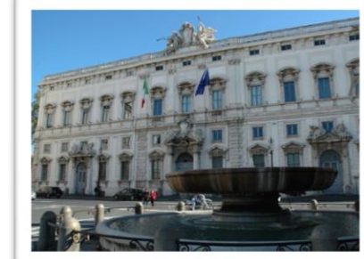
Palazzo della Consulta