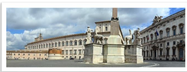
Piazza e Palazzo del Quirinale