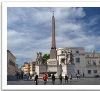
Obelisco del Quirinale