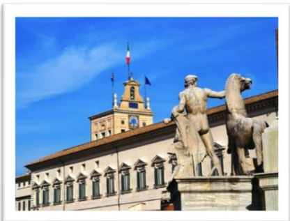
Palazzo del Quirinale